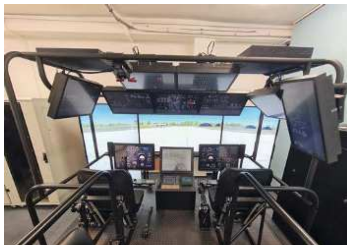
Trenažéry přispějí k vyšší efektivitě a bezpečnosti leteckého výcviku posádek vrtulníků