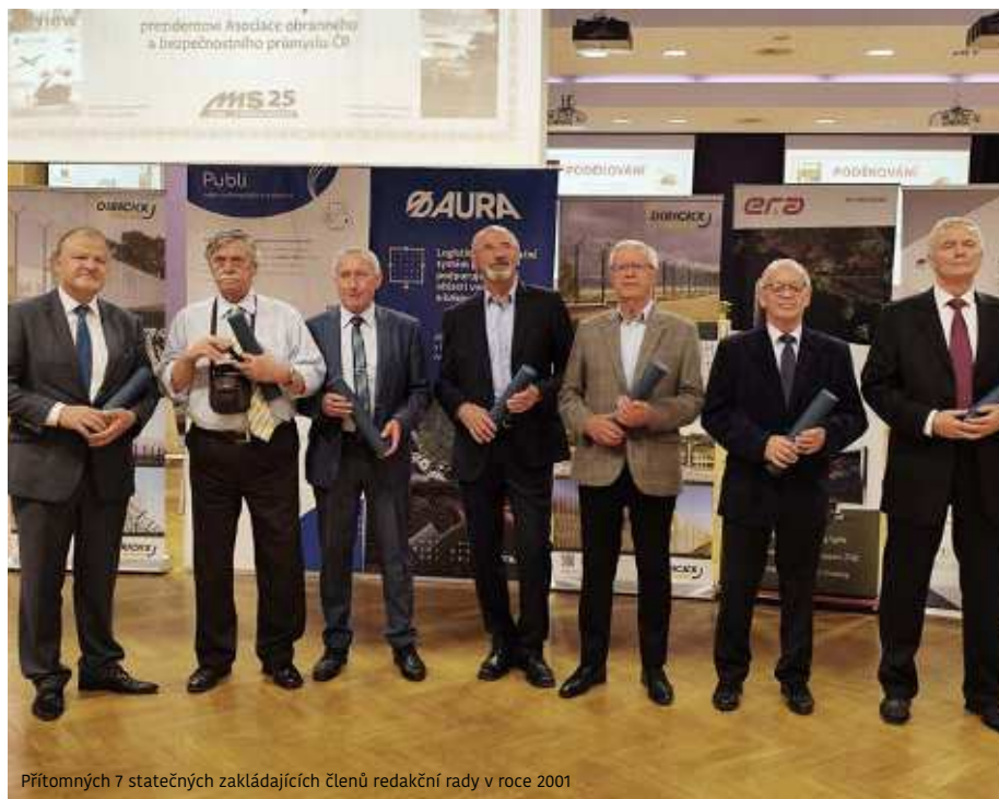
Přítomných 7 statečných zakládajících členů redakční rady v roce 2001